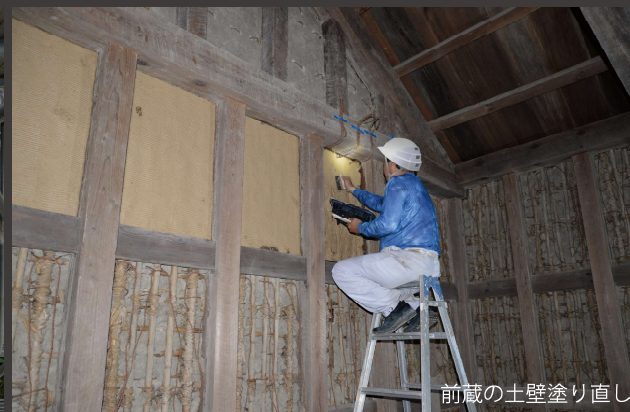
前蔵の土壁塗り直し