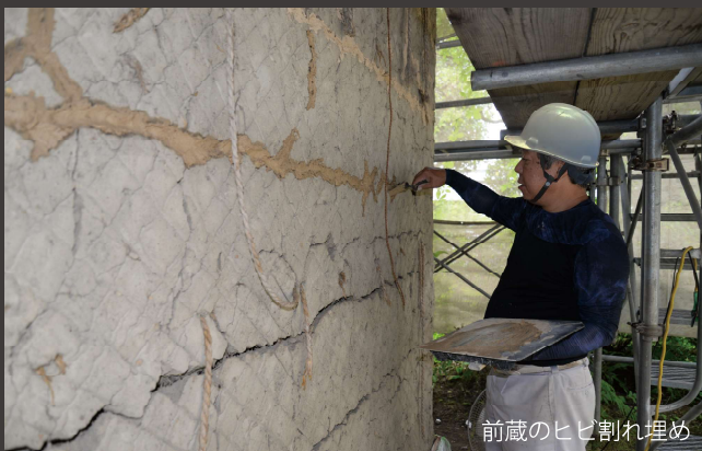
前蔵のヒビ割れ埋め