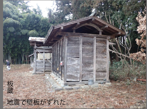
板蔵 地震で壁板がずれた。