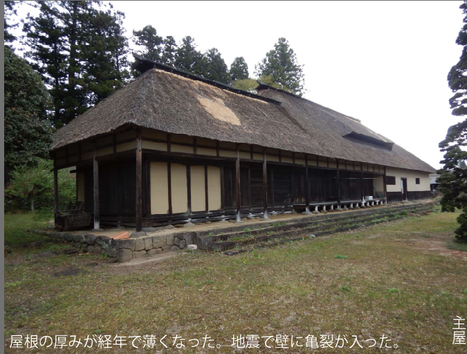
屋根の厚みが経年で薄くなった。地震で壁に亀裂が入った。