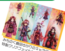
みちのく真田かかしのキャラクター 特製クリアファイルをプレゼント!

手作りお料理のメニュー 4月 ばたもち 5月 栗おこわ 6月 玉こんにゃく 7月 うーめん 8月 うーめん 9月 焼きいも 10月 芋煮汁 11月 芋煮