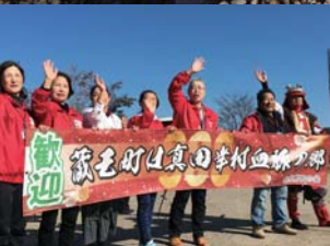
みなさまのお越しをお待ちしています！