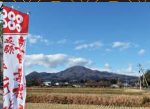
真田の郷から眺める青麻山の風景