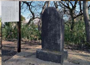
仙台真田氏本家・幸清の筆子塚