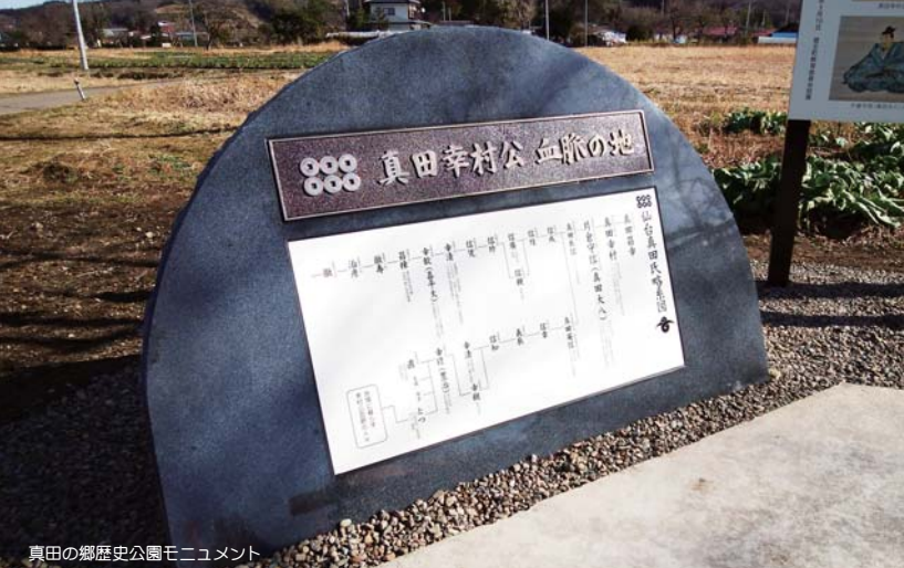
真田の郷歴史公園モニュメント