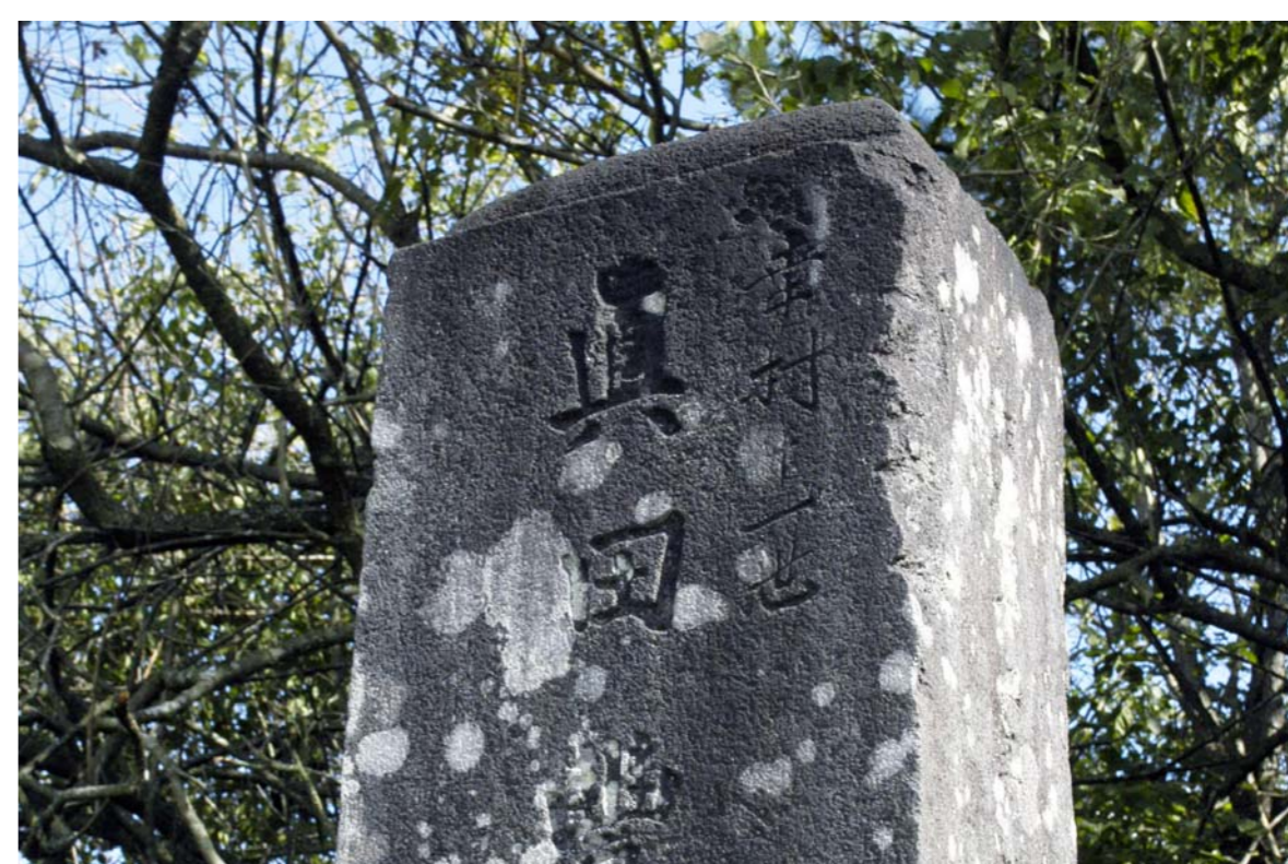
『幸村十一世』と刻まれた仙台真田氏の墓碑