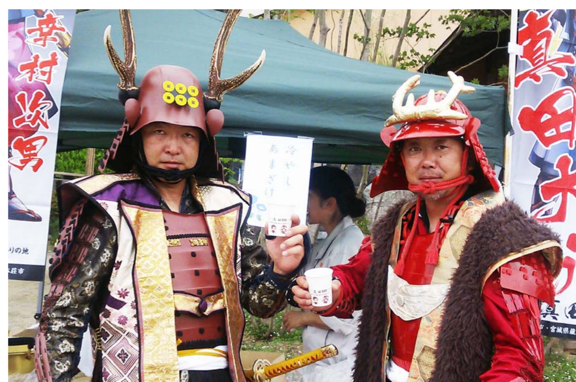
『仙台真田武将隊一縁一』おもてなし