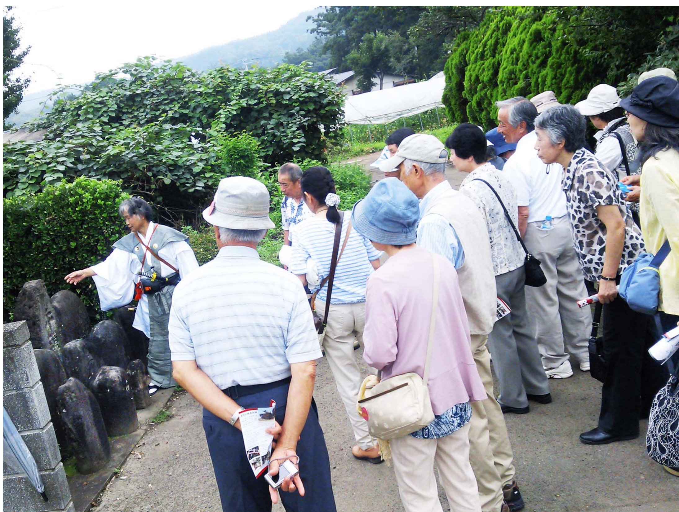
ボランティアガイドによる真田史跡ご案内