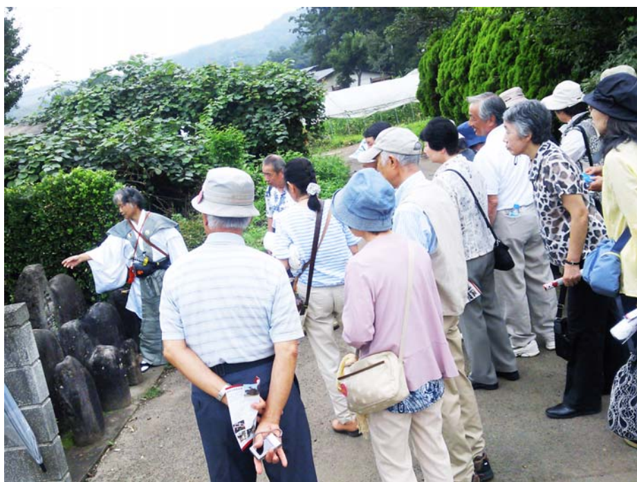
ボランティアガイドによる真田史跡ご案内