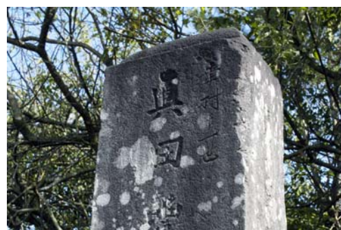
『幸村十一世』と刻まれた仙台真田氏の墓碑