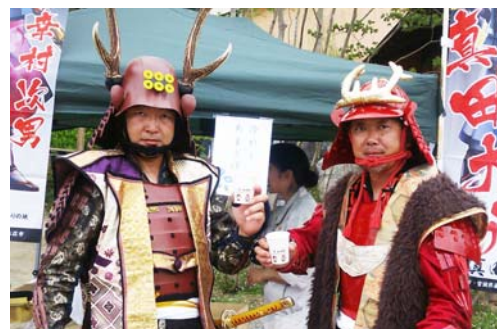
『仙台真田武将隊一縁一』おもてなし